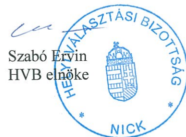
Szabó Ervin HVB elnöke